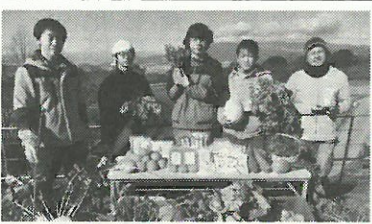
函南六本松 野菜農場

今回の新春トークは、とよけTV (https://tv.toyouke.com)で無料でいつでも視聴が可能だ。また、30年前、ワクチン信奉の崩壊