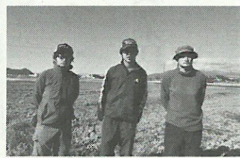
伊豆の国奈古谷 水田

るメガヒット商品を創出したという代表の方針もあり、新年から肌の衰えや毛の悩み対策のレメ