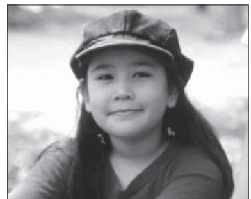
力強い意志を持つ子ども

④資格を取得することで、有資格者同士や、プロフェッショナル・ホメオパスとの間で、ネットワークを作るきっかけが得られ、自らの力で新たな世界を切り拓いていくことが可能となります。