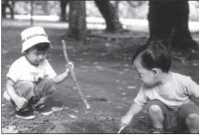
好奇心旺盛な子どもたち

日に設立され、活動を開始しております。このようなことからもお分かりになりますようにファミリーホメオパスの資格は、社会的に認められた非営利目的の財団法人の認定となりますので、ファミリーホメオパ