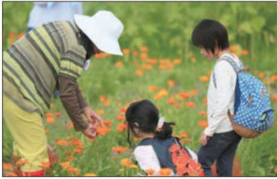
自然農園で心をきれいに して花摘みをする

A …ホメオパシーの基礎、哲学、および現代医学の解剖・生理・病理学、薬学、ホメオパシー病理のエッセンスを学び、その上で、セルフケアの考え方、マテリアメディカ、実践ケース、関連法規などを体系的に学び、家庭で日常に起こるさまざまな急性疾患に対応できるように知識を深めます。また、家庭でホメオパシーのレメディーだけでなく、ハーブ、フラワー