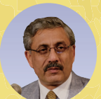
ラジ・クマー・マンチャンダ インド政府 AYUSH 長官